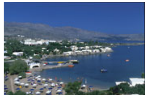
Kreta - Agios Nikolaos-Elounta