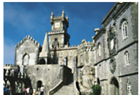
Sintra, Castel de Peve